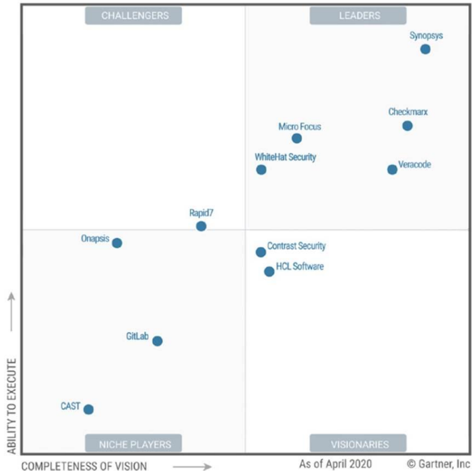
Figure 1. Magic Quadrant for Application Security Testing